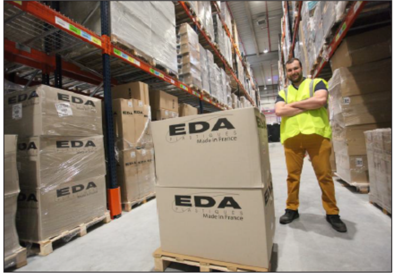
Toute l'activité e-commerce d'EDA est installée à Bellignat, où sont préparées et expédiées les commandes.