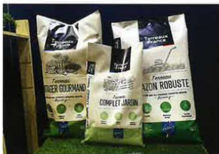
La gamme Terreux de France de Premier Tech est labellisée OFG.